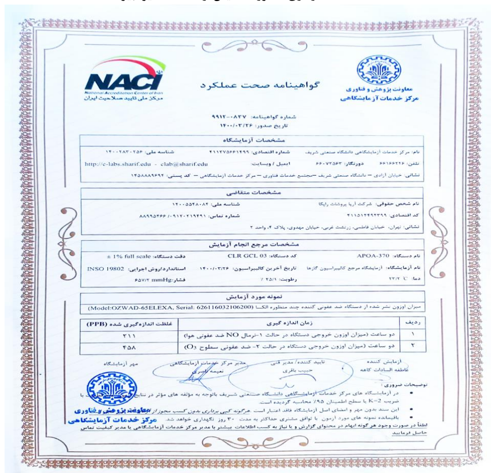
گواهینامه صحت عملکرد