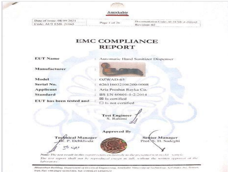
تست emc سازگاری الکترومغناطیس از دانشگاه امیرکبیر