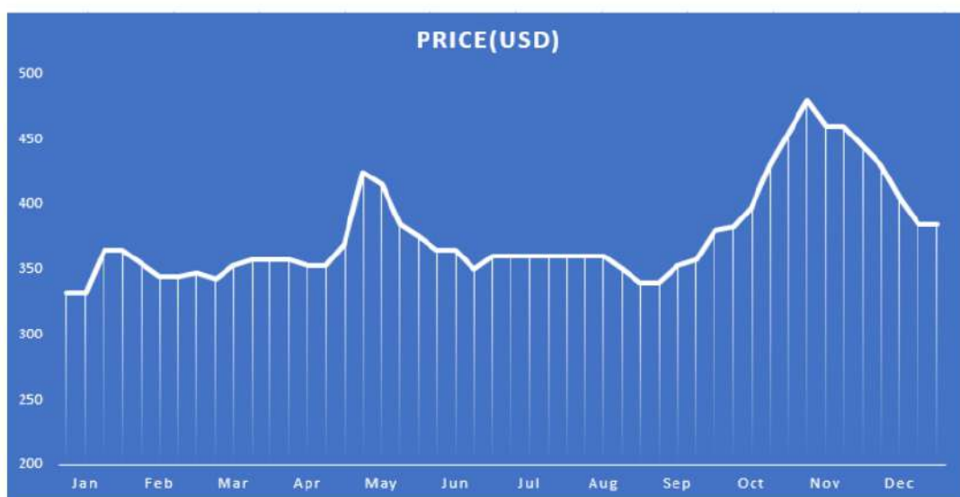
تصویر ۲-۳ قیمت جهانی قیر در سال ۲۰۲۱

در سال ۲۰۲۱، جهان همچنان به ویروس کرونا آلوده بود و دو سویه همه‌گیر دلتا و اومیکرون را تجربه کرد. همه‌گیری دلتا از هند سرایت کرد و منجر به مرگ ۶۰۰۰ نفر در یک روز شد که رقمی بی‌سابقه است این اتفاق منجر به کاهش قیمت نفت و قیر به مدت سه ماه شد تا اینکه واکسیناسیون در هند آغاز شد.