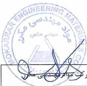
۲- نمونه فاکتور خرید و هزینه مواد اولیه